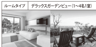
ルームタイプ デラックスガーデンビュー(1~4名1室)

詳しいアクティビティの内容はHPよりご確認ください。http://www.clubmed.co.jp/