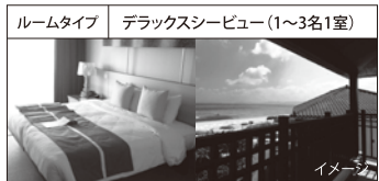
ルームタイプ デラックスシービュー(1~3名1室)